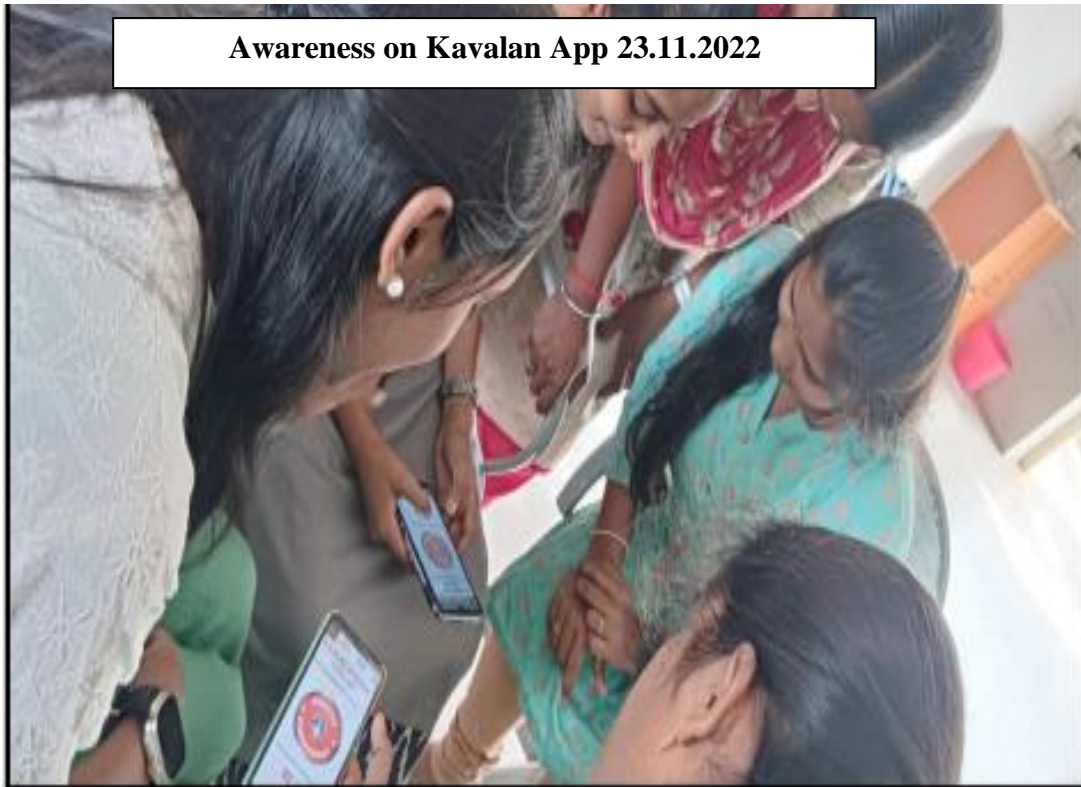
Awareness on Kavalan App 23.11.2022