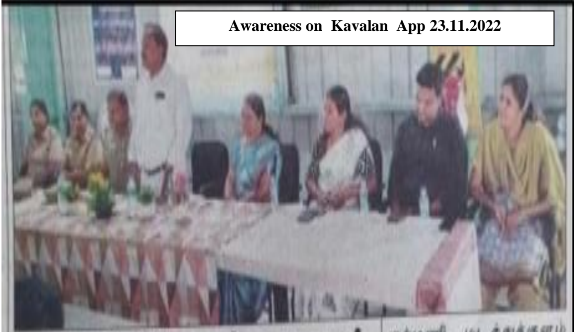
Awareness on Kavalan App 23.11.2022